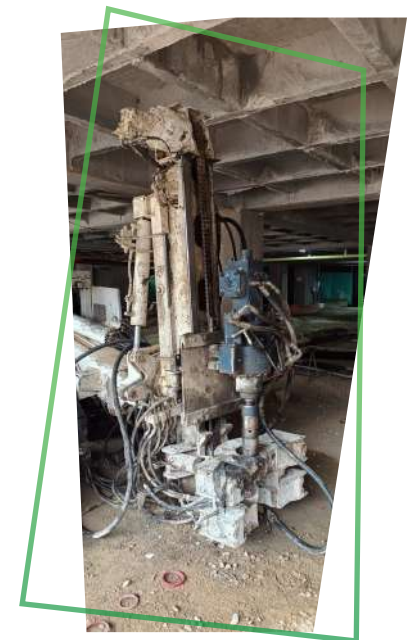
CMV MK420-D con martillo Yonda YDH2004