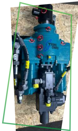
Eurodrill RH 2X