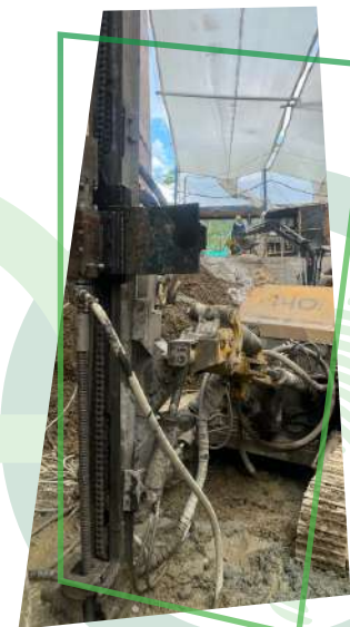
Shandog 140YF con martillo Klemm KD204