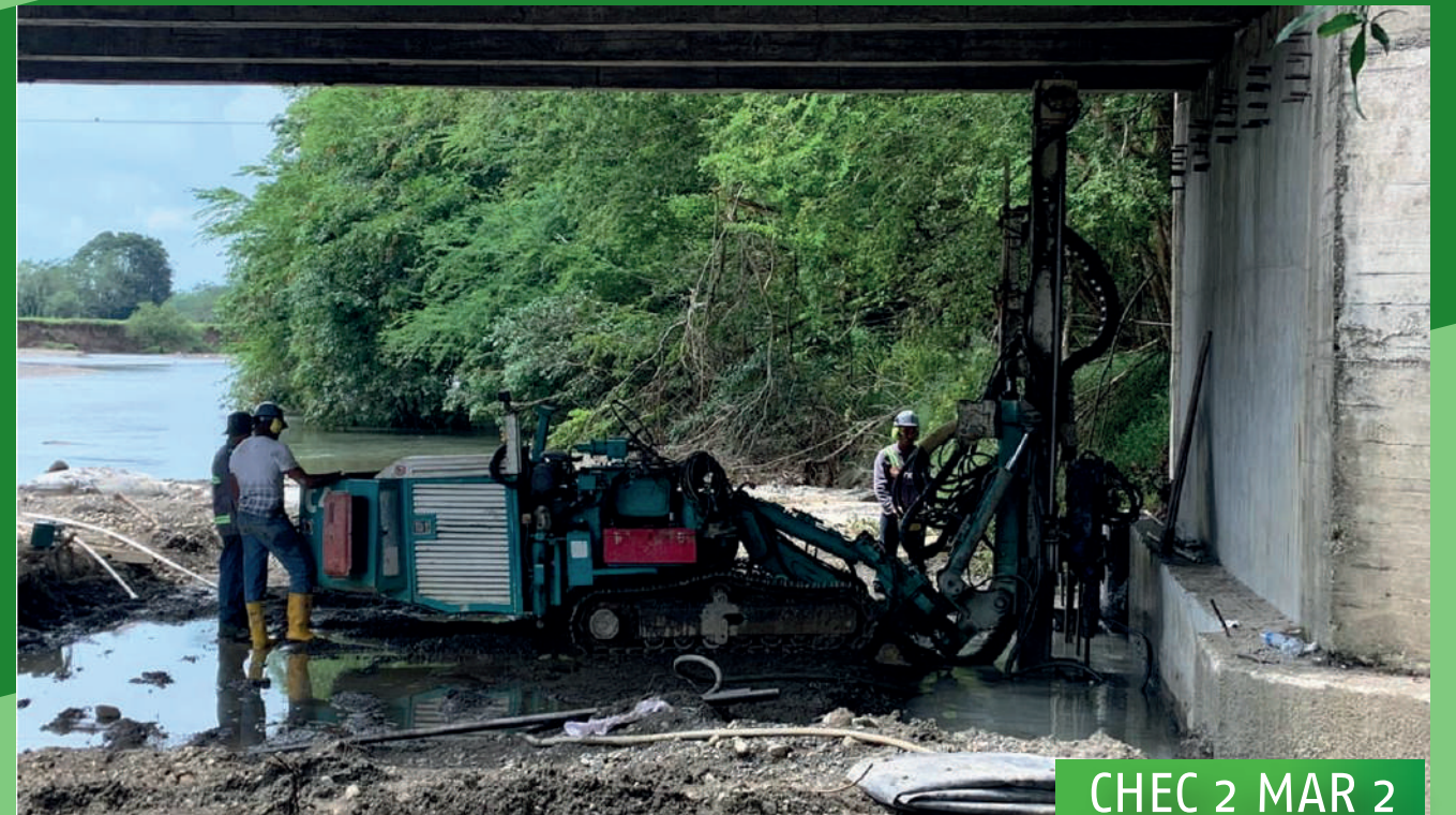
CHEC 2 MAR 2