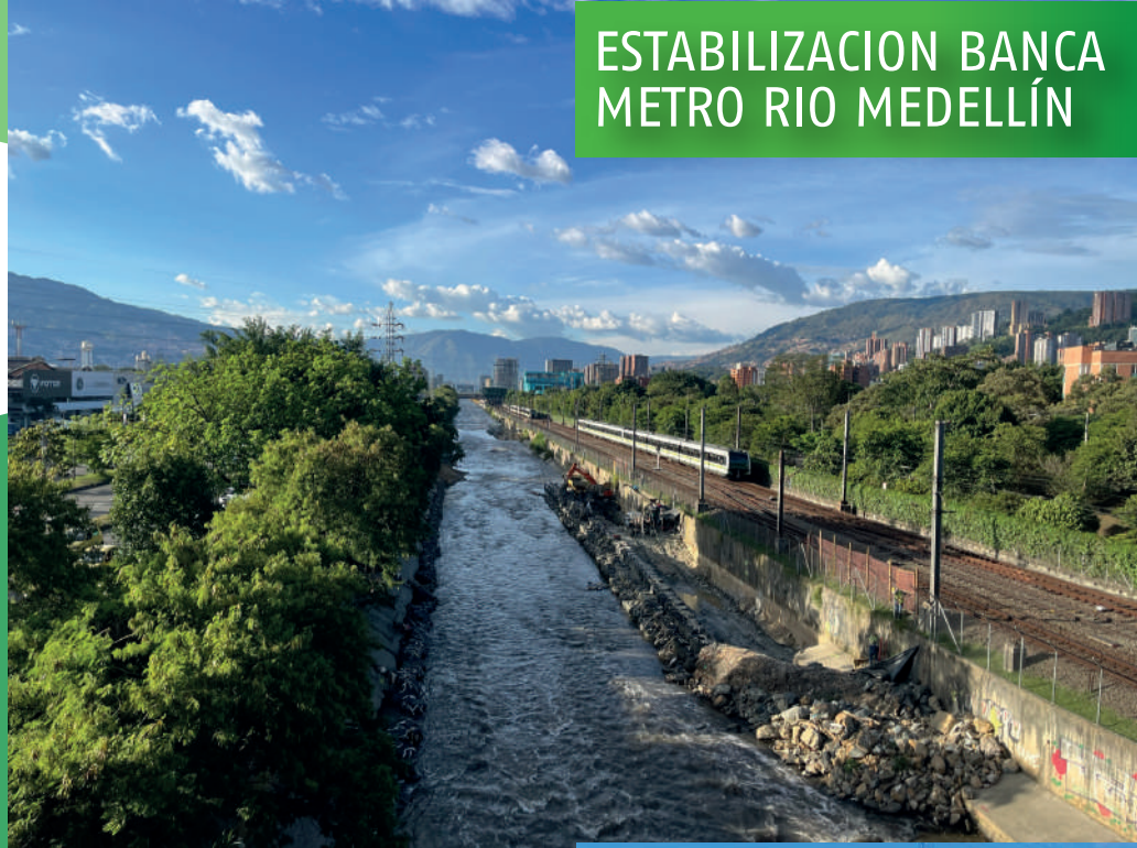
ESTABILIZACION BANCA METRO RIO MEDELLÍN